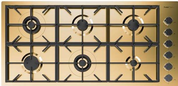
Table de cuisson Foster Milano PVD Gold