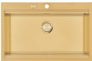
Évier Milanello Gold workstation 1034 059